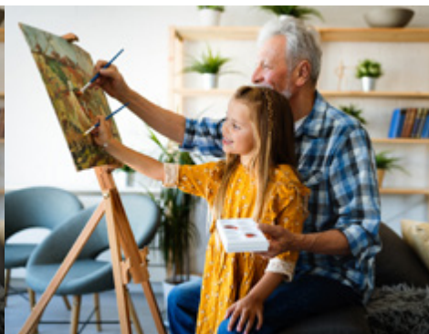
Klare Sicht ohne AMD